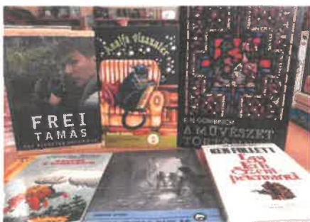
Néhány a könyvtárnak felajánlott könyvek közül

Adventi mesenaptár a könyvtárból: December 1-24-ig minden nap 17 órakor egy kedves történetet, népmesét, mítoszt, legendát tettünk közzé a Sajószöged Könyvtár Facebook oldalán. A meséket olvasva egy igazi szívből jövő ajándék kerülhetett így estéről-estére a mesenaptárba. Célunk az, hogy napról napra elvigyük az olvasóinkhoz a meséket, segítve a nyugodt, örömteli készülődést karácsonyig.